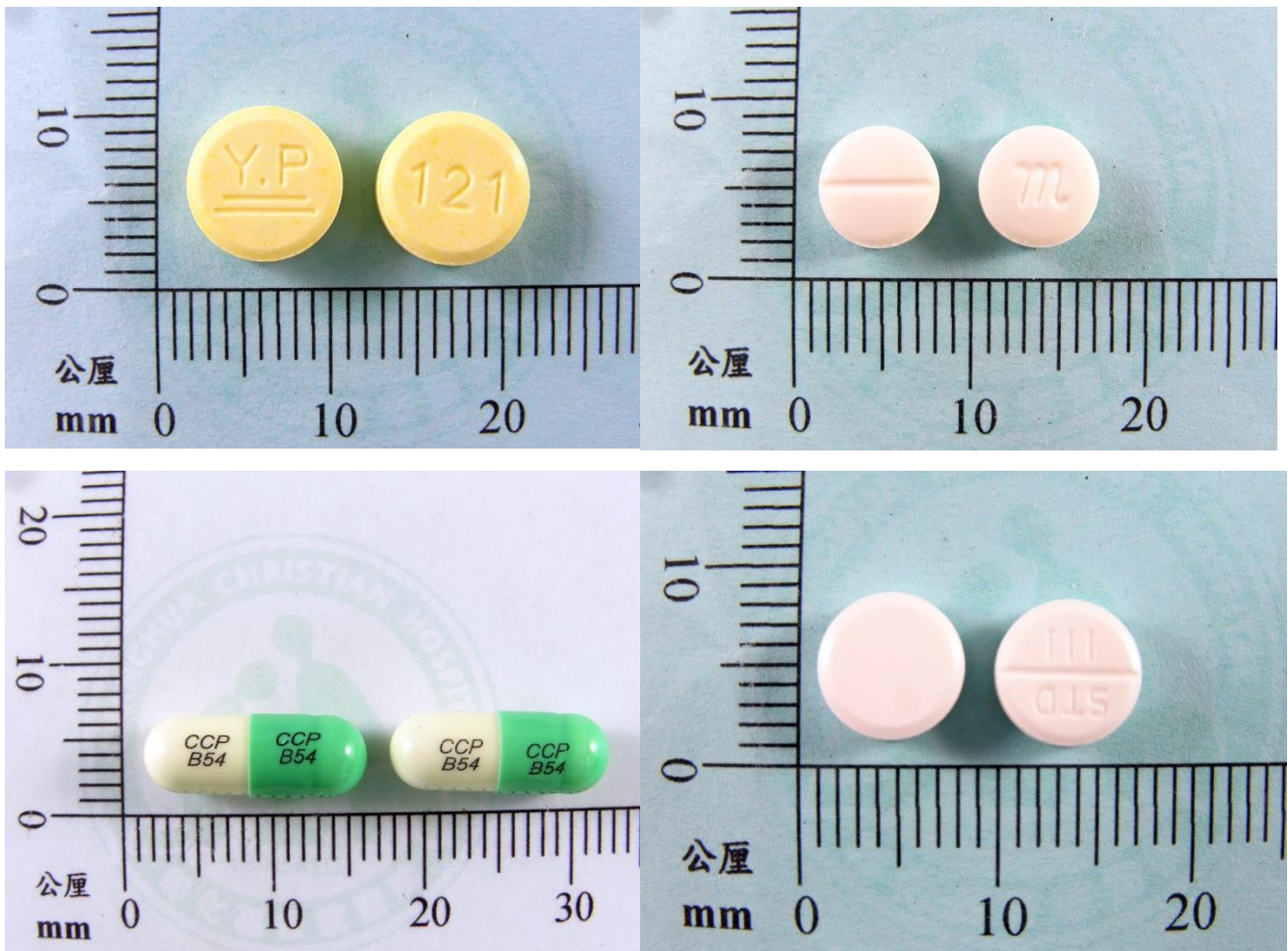
附圖一：裸錠(膠囊)：刻痕務必清晰可識別