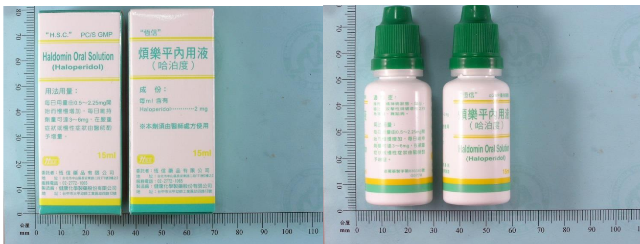
附圖四：拍攝直接承載內容物之包裝，其標籤、標示須清晰可識別